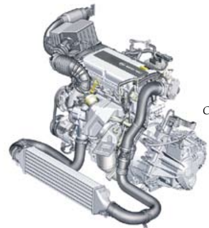
Corsa GSi:n 1,6-litraisen turbomoottorin maksimiteho on 110 kW (150 hv) ja vääntömomentti käytännön ajossa peräti 210 Nm.

Opel Corsa GSi:n hinta on kolmiovisena 23990 euroa ja viisiovisena 24820 euroa.