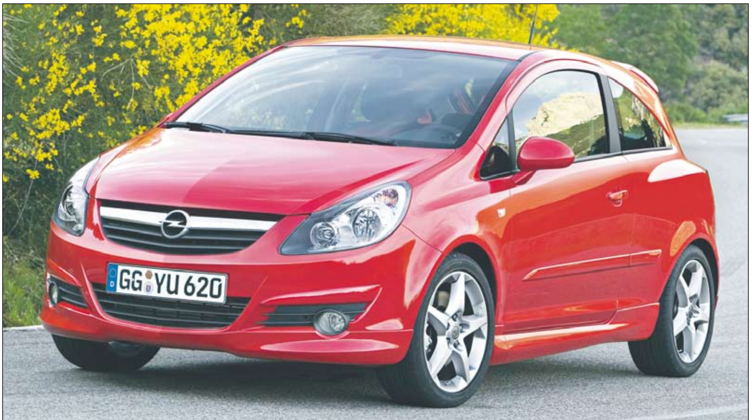
Uuden Corsa GSi:n suorituskyky on mainio mutta yhdistetty polttoaineenkulutus silti vain 7,9 litraa / 100 km. Auto alittaa tulevat Euro 5 -päästörajat.

Kuljettajan apuna ovat vakiovarusteisiin kuuluvat muun muassa lukkiutumattomat ABS-jarrut hätäjarrutehostimella, sähköinen jarruvoiman jako, aliohjautumisen estojärjestelmä sekä suoria jarrutuksia vakauttava SLS-järjestelmä. ESPP-lus-ajonvakautus sallii hieman normaalia urheilullisemman ajotyylin