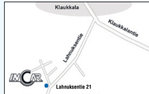
InCar Klaukkala, Lahnuksentie 21, 01480 Klaukkala

KLAUKKALA • Vauriokorjaamo Puh. 020 787 9480 klaukkala@incar.fi MA - PE 07.30 - 16.30