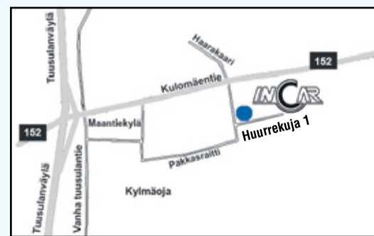
InCar Tuusula, Huurrekuja 1, 04360 Tuusula.

TUUSULA • Automaalaamo Puh. 020 787 9483 tuusula@incar.fi MA - PE 07.30 - 16.30