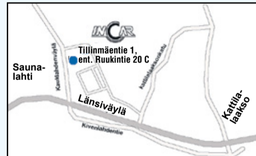
InCar Espoo, Tillingmäentie 1, 02330 Espoo, entinen Ruukintie 20 C.

ESPOO • Vauriokorjaamo Puh. 020 787 9487 espoo@incar.fi MA - PE 07.30 - 16.30