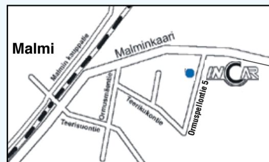
InCar Malmi, Ormuspellontie 5, 00700 Helsinki

– kenenkään ei tarvitse odottaa viikkokausia.