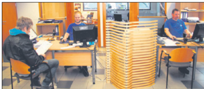
Töiden vastaanotto InCarin viihtyisissä asiakaspalvelutiloissa.