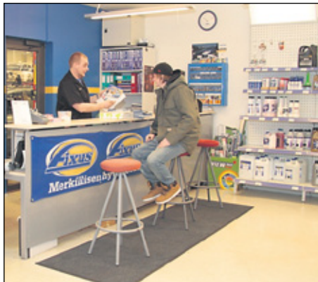
Autokorjaamo Praktikumin Fixus-varaosamyymälä.

Helsingissä kauppakeskus Arabian takana os. Jan-Magnus Janssonin aukio 5 sijaitsevassa Praktikumin ammattikoulussa huolletaan ja korjataan oppilastyönä kaikkia henkilö- ja pakettiautoja.