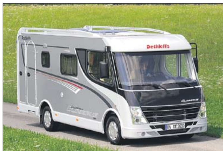
Dethleffs Advantage 15 Luxus on mielenkiintoinen uutuus ainutlaatuisella pohjaratkaisullaan.