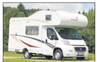
Sunlight A 58, saksalaista laatua edulliseen hintaan.

Hyvien talviominaisuuksien perusteena on riittävä ilmankierto ja ilmanvaihto. Dethleffsin kehittämä Air Plus -järjestelmä parantaa ilmankiertoa ja ehkäisee siten kondenssiveden muodostumista sisätiloihin.