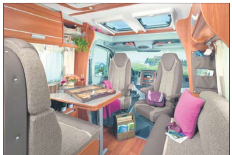
Dethleffs Globeline 7043 Havanna -matkailuauton salonki.

Kaikki tutut pohjaratkaisut säilyvät mallistossa edelleen. Tämän