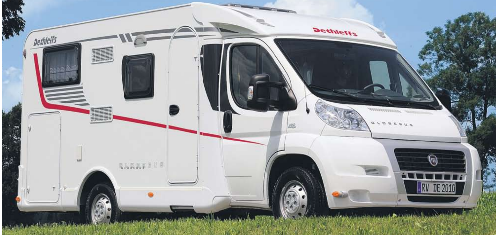
Uudet Esprit T- ja Globe4-mallisarjat laajentavat entisestään Dethleffsin kattavaa puoli-integroitujen mallistoa.

Helsinki Caravan Oy on vuonna 1976 perustettu täyden palvelun caravan-tavaratalo ja johtava matkailuajoneuvon erikoisliike pääkaupunkiseudulla. Helsinki Caravanista saat kaiken, mitä mukavaan ja turvalliseen matkantekoon tarvitset.