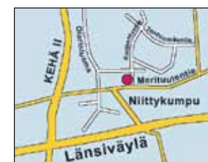
Delta Auto Espoo, Niittykumpu, Kotitontuntie 2, hyvät yhteydet joka puolelta.

Delta Auto Espoo, Niittykumpu Kotitontuntie 2, 02200 Espoo. Puh. automyynti 0207 408 801 Avoimna ark. 9-18, la 10-15 www.delta.fi