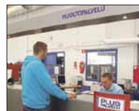
Asiakaspalvelu tarjoaa merkki-kohtaista asiantuntemusta.

Uusinta uutta Delta Auto Espoo, Niittykummun vaihto-autotarjonnassa edustaa konsernin valtakunnallinen HELMI-konsepti, johon hyväksytyt 0–6 vuoden ikäiset vaihtoautot ovat läpäisseet 111 kohdan tarkastusohjelman. Kaikille alle 3 vuodenikäisille ja alle 60 tkm ajetuille HELMI-autoille annetaan täys-takuu 2 vuotta / 30.000 km. Vanhemmille enintään 150.000 km ajetuille HELMI-autoille annetaan käyttöturva 15.000 km / 12 kk. Lisäturvaa tuo vielä 30 vrk:n vaihto-oikeus sekä ilmainen 24 h tiepalvelu.