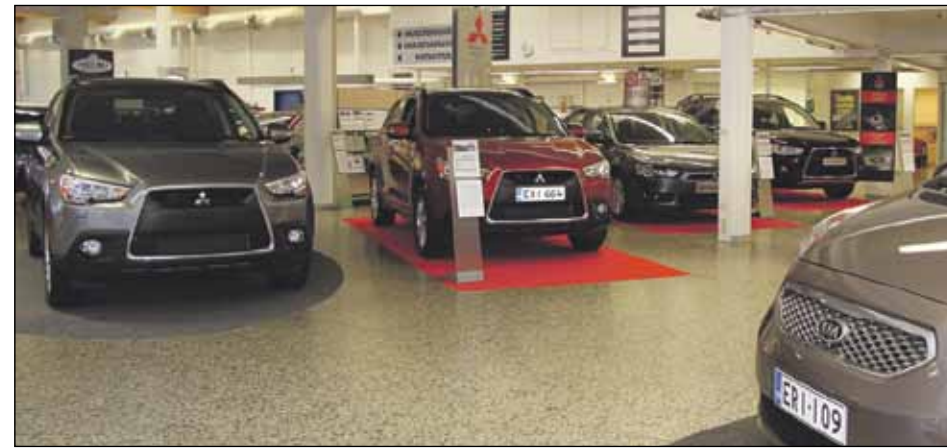
Uusien autojen tilavassa ja viihtyisässä myymälässä on nähtävillä laaja valikoima uusia Kia- ja Mitsubishi-autoja.

– Uusin malli on Mitsubishi ASX, 1,6-litraisella bensiini-koneella tai 1,8 dieselkoneella varustettu crossover, joka on jo noussut suosikiksi. TM:n testissä no 18/2010