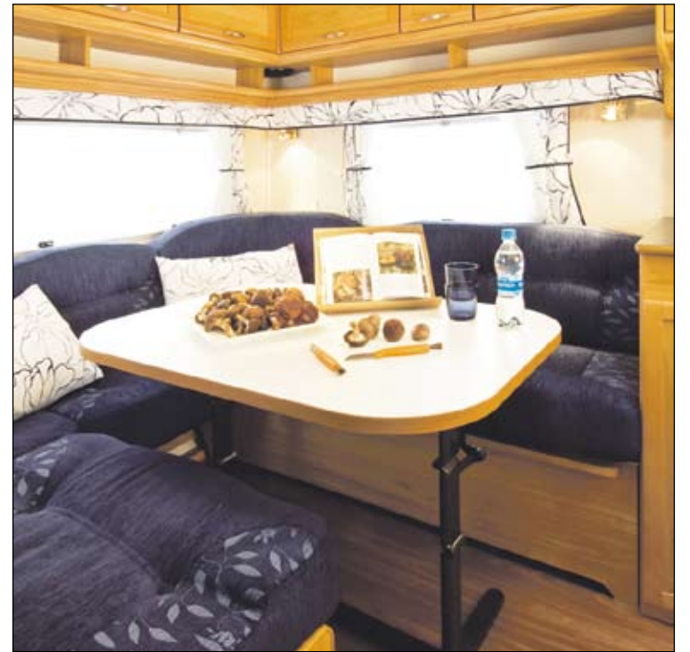
Solifer Artic 560E -matkailuvaunun salonki.

Vaunun veto-ominaisuudet ja ajonautinto korreloivat suoraan keskenään. Solifer on panostanut vaunujen tuotekehityksessä ja suunnittelussa juuri veto-ominaisuuksien optimointiin. Korin oiva painonjakauma ja aerodynaaminen muotoilu vähentävät ilmanvastusta, ja vaunu seuraa kitkattomasti perässä niin tuulessa kuin tuiskusakin. Aerodynaaminen muotoilu