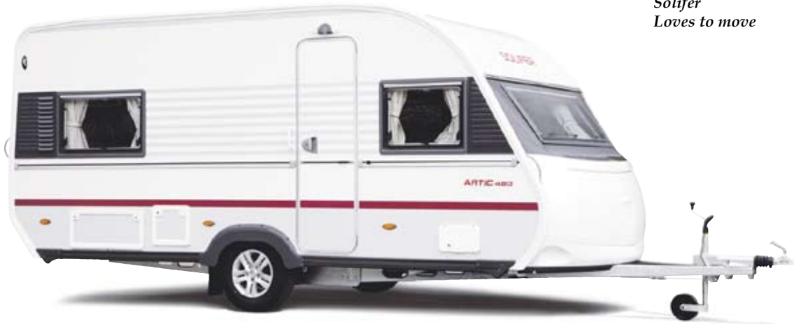
Solifer Loves to move

Solifer Artic 480 on malliston pienin ja kevein matkailuvaunu, jossa on makuutilat neljälle. Soveltuu erinomaisesti ympärivuotiseen käyttöön. Hinta alk. 22.450 €.