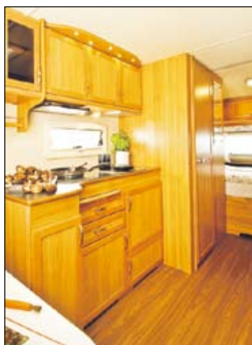
Solifer Artic 560E -uutuusmallin keittiö. Lisävarusteena isompi jääkaappi/pakastin korkeassa kaapissa.

Solifer-matkailuvaunut ovat 45-vuotisjuhlan kunniaksi kokeneet todellisen kasvojenkohoutuksen; vaunujen etuosa on täysin uudistettu entistäkin aerodynaamisemmaksi ja samalla myös entistä tyylikkäämmäksi, toimivammaksi ja tiiviimmäksi. Uusi kaasupullokotelo helpottaa pullon vaihtoa. Myös vaunujen sivuilla ja takaosassa on uudistuksia: mm. koko vaunun pituinen, entistä leveämpi ja tukevampi telttalista sekä reilumman kokoinen suksiluukku, joka on nyt vakiona lähes kaikissa malleissa.