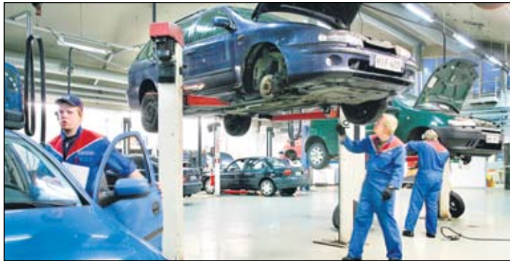
Kymmenen autoalan ammattilaista käytössään parasta autoteknologiaa. Töiden läpivieminen on nopeaa.