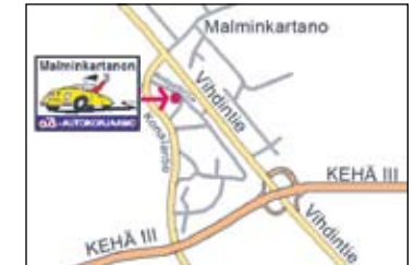
Malminkartanon Autohuoltoon on hyvät yhteydet joka puolelta.

Malminkartanon Autohuolto Ristipellontie 14 00390 Helsinki (Konala) Puh 09 591 5630 E-mail: asiakaspalvelu@mkah.fi www.mkah.fi