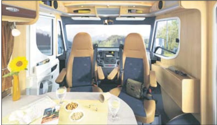
Ilmastoitettu matkailuauto on viihtyisä lomakoti pyörien päällä.

Haluaisitko sinä vaihtaa maisemaa mielesi mukaan ja samalla nauttia majapaikan pysyvyydestä? Vuokraamalla matkailuauton pääset kätevästi karavaanitielle.