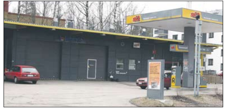
Ripoilin nykyaikainen toimitalo on rakennettu v. 2004.

tai päivätaksan mukaan, asiakkaan tarpeesta riippuen. Autonvuokruspaketit räätälöidään asiakkaan tarpeen mukaisesti ja tyytyväisiä asiakkaita on ympäri Uuttamaata.