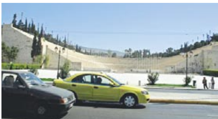
Maraton päättyy tälle olympiastadionille.