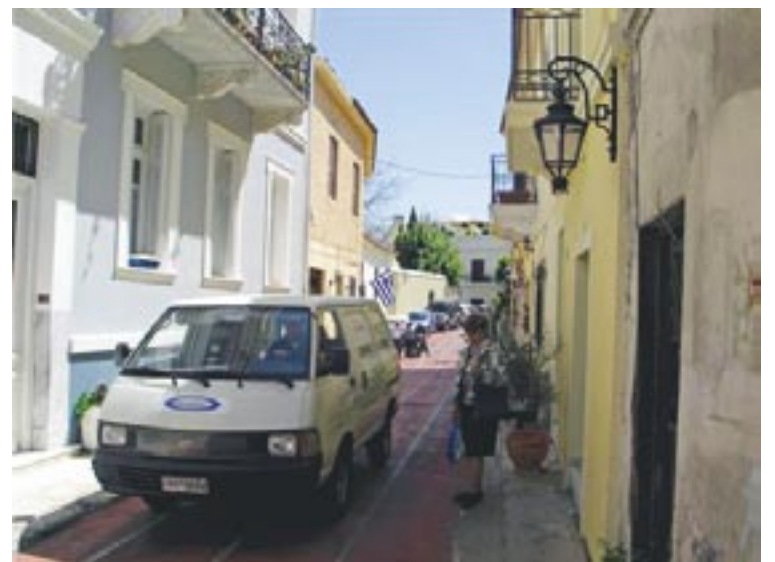
Ateenan vanhaa kaupunkia Plakaa.