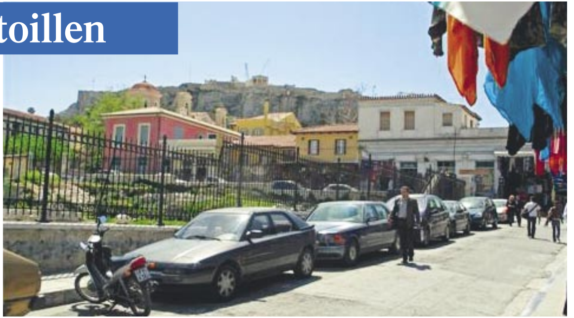
Ateena Plaka, taustalla Akropolis.

Herodotoksen antiikin historiassa kerrotaan Persian kuninkaan Darioksen lähteneen sotaretkelle Attikaan 490 eKr. Kreikkalaiset löivät nämä paljon suuremmat persialaisjoukot uskomatonta rohkeutta ja taistelutaitoa osoittaen. Persialaisten sotalaivasto käsitti 600 laivaa. Taistelut käytiin Marathonin rannoilla. Persialaisilla oli 30.000 miestä ja kreikkalaisilla 10.000. Kreikkalaisia kuoli vain 192, näiden hautakumpu on yksi Marathonin nähtävyyksistä. Voitonviestiä viemään lähtenyt Pheidippides kuoli perillä Ateenassa juoksun aiheuttamaan uupumukseen. Hän ei ilmeisesti ollut niin hyvin tree-