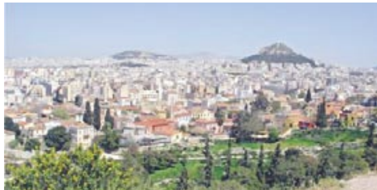
Ateenaa, kukkulalla Likavitosin teatteri.