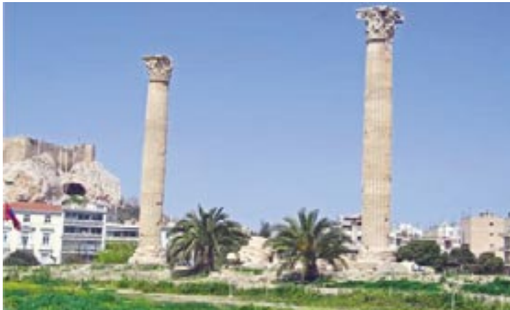
Olympian Zeuksen temppelistä jäljellä vain muutama pylväs.