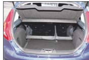
Muunneltavan tavaratilan koko on 250 litraa ja laajennettavissa takapenkkien selkänojat kaatamalla.

Sisätiloissa huomio kiinnittyy Fiestan voimakkaasti korostuvaan mittaristoon ja koelaudan keskiosan audiosäätimiin. Ajotietokoneen ja mittariston näytöt ovat selkeät, kun taas mittariston kehyksen kirkaspintainen hopeanvärinen maali heijastaa voimakkaasti ja tekee mittaristosta levottoman näköisen. Lämmityslaitteen säätimet muodostavat keskitetyn kokonaisuuden, mutta niiden käyttö on erittäin hankalaa ja vaatii voimaa. Penkinlämmittimien katkaisijat on tehokkaasti piilotettu penkin sivuun, eikä edes merkkivalo kerro