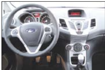
Sisätiloissa huomio kiinnittyy Fiestan voimakkaasti korostuvaan mittaristoon ja koelaudan keskiosan audiosäätimiin.