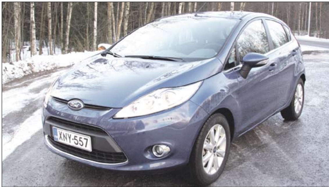
Viime vuoden lopulla markkinoille tullut Ford Fiesta on tehty yhteistyössä Mazdan kanssa. Viisiovinen hatchbackin ooh. on 17 850 e.

Moottorina koeajetussa Fiestassa on 1,6-litrainen diesel. PSA-konsernin kanssa yhteistyönä syntyneessä alumiinimoottorissa on yhteispaineruiskutus, pakokaasuahdin ja imuilman välijäähdytys. Moottori kehittää 66 kW:n tehon ja 204 Nm:n väännön. Hiilidioksidipäästö on 110 g/km. Hiukkasuodatin vähentää omalta osaltaan päästöjä. Neliventtiilijärjestelmää käyttää kaksi nokka-akselia. Jakopää on ketjukäyttöinen. Dieselmootorin hitaan lämpiämisen vuoksi lämmityslaitteeseen on asennettu sähkövastus, joka tehos-