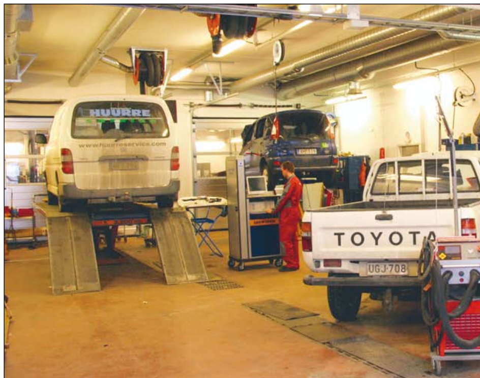
Korjaamon laajennusosaan hankittiin mm. kaksi uutta korinoikaisupenkkiä ja elektroninen korinmittauslaite. Korjaustyöt sujuvat entistäkin nopeammin.