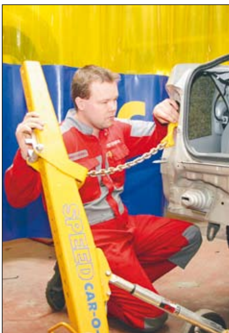
Vetolaitteella kulmat alkuperäiseen kuosiin.

Jo kaksi vuotta menestyksekkäästi käytössä ollut korikorjaamon laajennusosa on osoittanut toimivuutensa. Pitkään pääkaupunkiseutua vaivanneeseen kapasiteettipulaan on näin saatu helpotusta korikorjauksen osalta. Resursseja korikorjaamolla on riittävästi – myös talvella, jolloin kysyntä kasvaa.