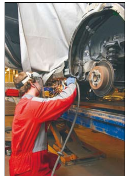
Kaikki lähtee kunnan suojauksesta. Korikorjaus on tarkkuutta vaativaa työtä.

Trans-Huollon alihankkijamaalaamo toimii korikorjaamon vieressä. Näin saadaan nopeutta korikorjauksiin, kun autojen siirtelyt jäävät minimiin. Pienemmät vaurikorjaukset kestävät vain 1-2 päivää.