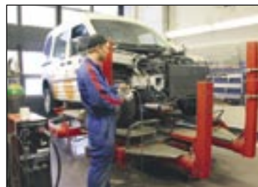
Korinoikaisulaitteistolla auto saadaan vedetyksi niihin mittoihin, joissa se oli ennen vahinkoa.