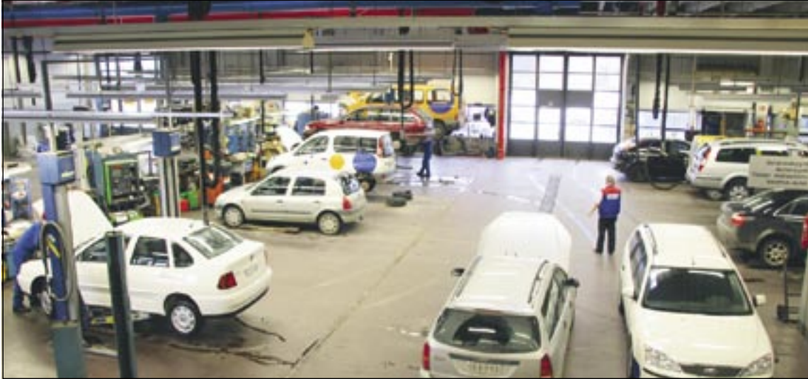
Noin 1500 m 2 huoltohallissa on 19 nosturi paikkaa henkilö- ja pakettiautoille.

Suuri valtakunnallisesti toimiva yritys palvelee monipuolisesti myös pääkaupunkiseudun autoilijoita. Raskone Oy:llä on AKL:n jäsenkorjaamoehdot täyttävä henkilö- ja pakettiautojen monimerkkiautotalo Helsingin keskustan läheisyydessä hyvien liikenneyhteyksien päässä Pohjois-Pasilassa noin 3,5 km Kehä 1:stä linnuntietä etelään.