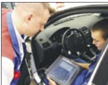
Fordin testerin näyttö paljastaa huolto- ja korjaustarpeet.