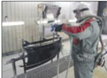
Osien maalaus ennen asennusta takaa hyvän lopputuloksen.

Pikahuolto, sijaisautopalvelu, pikapesut, käsinpesut, sisäpuhdistukset, vahaukset, katsastuskunnostukset, katsastuskäynnit ja jopa noutopalvelut pk-seudulla kuuluvat toimenkuvaa. Rengashotelli on oiva ratkaisu renkaiden säilytykseen. Palvelua täydentävät merkkikohtaiset huoltosopimukset, joiden suosio näyttää olevan myötätuulussa.